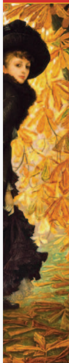
detail werk James Tissot

exposities • lezingen • concerten film • proeven en beleven • feest